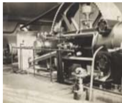
La machine à vapeur de l'usine Simonnet

Seules la tuilerie Huguenot et la tuilerie Simonnet peuvent faire les investissements nécessaires pour produire cette tuile : une machine à vapeur pour broyer et malaxer la terre afin d'obtenir une pâte molle que l'on peut mouler et un four Hoffmann pour une cuisson continue.