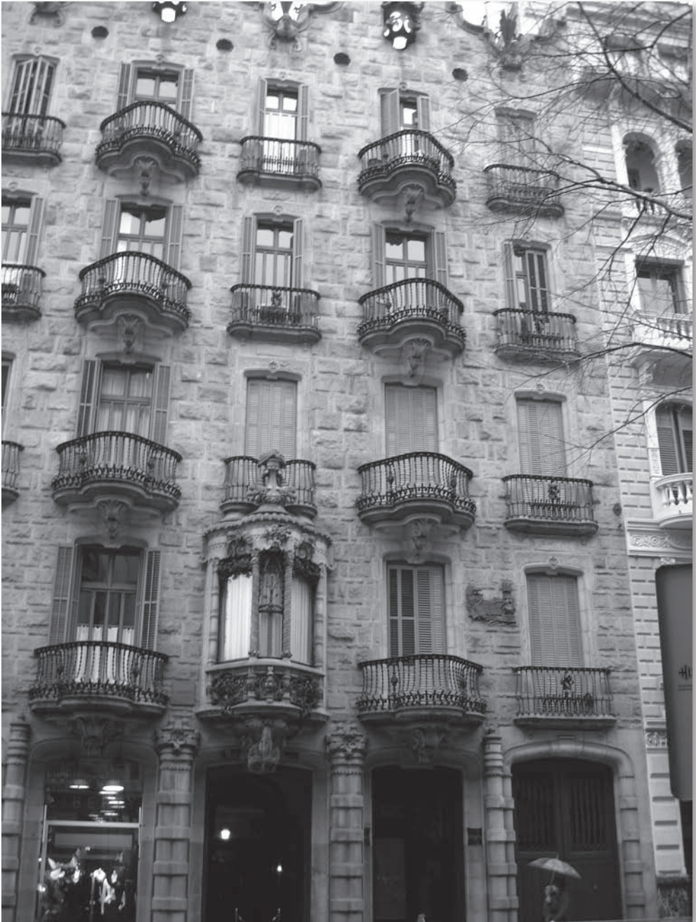
La maison Calvet, exécutée par Gaudí, est le type même des maisons d'entrepreneurs, avec les entrepôts au rez-de-chaussée, l'étage noble où vivait l'industriel et sa famille, le reste de l'édifice étant loué comme maison de rapport. Calvet était un industriel du textile de la vallée du Ter.