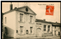
Avant la guerre

Le départ a lieu place de la mairie. Ce bâtiment a été détruit en 1914, puis reconstruit et terminé en 1924. Avant la guerre, il se trouvait en bordure de route.